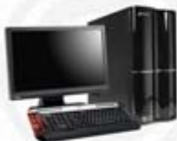
Computadora PC AMD Phenom II Power