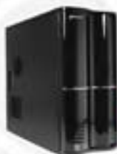
Gabinete Thermaltake Soprano RS 101