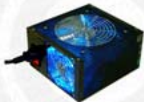
Fuente Powercooler PS-550TR