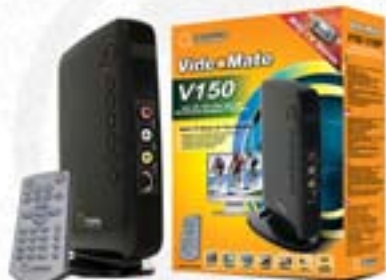
Sintonizador de TV VideoMate V150 Externa. Control remoto incluido.