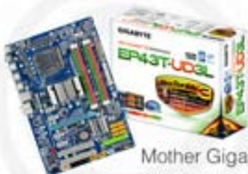
Mother Gigabyte GA-EP43T-UD3L Box